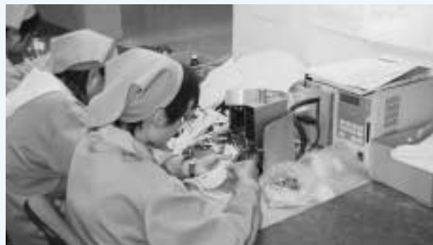
特種電線... - 30 から +105 まで耐えられる電線。特に低温耐性が要求される

ただ我々日本人会と城陽区政府との間で意見交換会を年2回開催しています。開発区の管理委員会も誠実に対応してくれますし率直な意見交換ができます。増徴税の不還付問題のときは戦いましたよー(笑)。