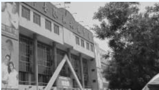
全国的規模の即墨市・服装卸売市場