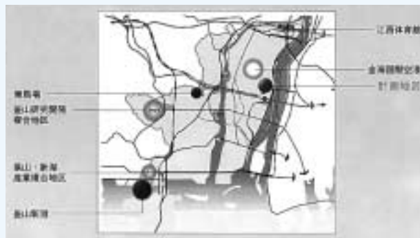
西釜山物流流通センター

鹿山、新湖、ジサ科学産業団地を含む産業団地の中心に位置し、物流産業団地としての総合的な役割を果たす。