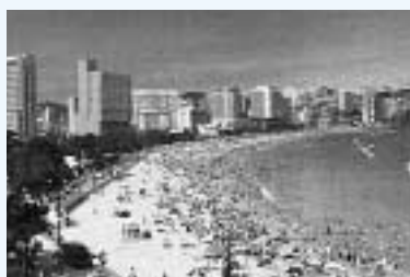
弓形の白浜が2kmほど続く海雲台(ヘウンデ)ビーチ