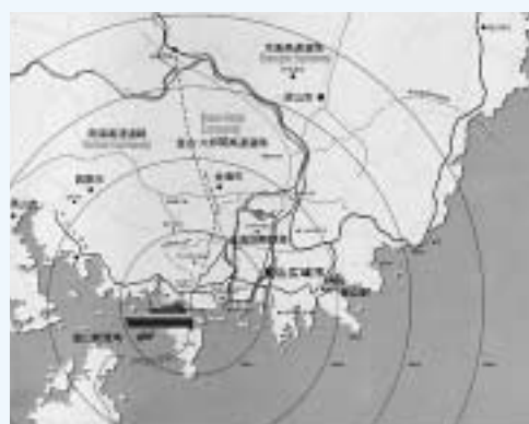
釜山新港湾背後複合物流団地からのインフラ施設状況