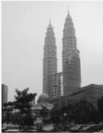
マレーシア経済が最高潮だった時に建てられた現在世界第2位の高さのビル

税の一部免除又はその全額の免除が有り、期間は5年間であるが更に5年の延長も可能。実際の奨励生産品目としては電子/コンピューター/バイオテクノロジー/航空/宇宙産業と成っている。