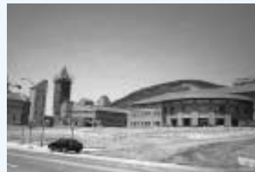
現在建設中の東北大学東軟信息技术学院

大連で最も多くのIT人材を輩出している「大連理工大学」の就職担当者にインタビューしたところ、「今年のソフト開発学部の卒業生は、早い時期にほぼ全員が採用契約を結