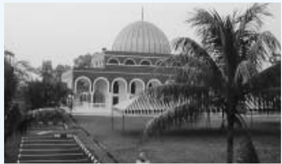
イスラム教徒が礼拝をするモスク