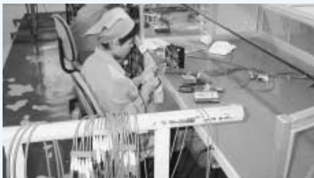
心電図の部品は北京へ

医療面では、残念ながら現在青島に日本人医師はおりません。ですが青島医科大付属医院の副院長さんは日本語が大変流暢です。外国人専用診療室があり、しかも外国人料金は取られません。