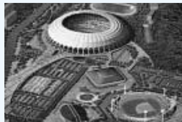
釜山アジア競技大会メインスタジアム

釜山は山、川、海が三位一体となった天恵の観光資源に恵まれ、東釜山圏は先端技術と自然が結合された1,172,000㎡規模の未来先端複合都市センタムシティー（Centum City）と7,636,000㎡の東釜山観光団地開発を通じた観光・情報通信の拠点として、西釜山圏は生産・物流拠点として、既存の都市地域は貿易・金融拠点都市としての3大圏域別特化開発計画を中心に開発をしています。また2002年には、ここ釜山で「アジアを一つに、釜山を世界に」をキャッチフレーズに第14回アジア競技大会が開催されます。